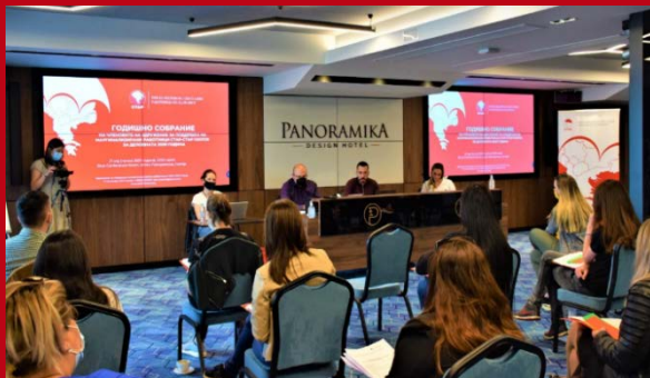
Фотографија: Архива СТАР-СТАР, 2021

гласање ги избра членовите на Управниот одбор со мандат од 4 години, а избраните членови со јавно гласање избраа и Претседателка на Управниот одбор. Во рамки на изборниот дел од седницата на Собранието и точката на гласање за избор на Претседател, Собранието како највисок орган изгласа доверба и именуваше Претседател во времетраење од 4 години, почнувајќи веднаш, а завршувајќи на 20.05.2025 година за извршување на функцијата Претседател на Собранието и Здружението.