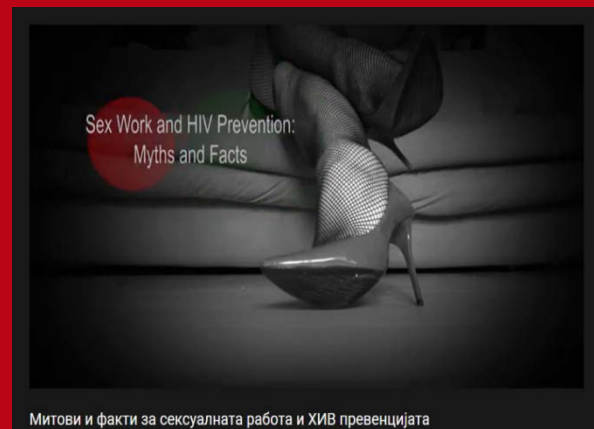
Митови и факти за сексуалната работа и ХИВ превенцијата

Со цел да ја подигнеме свеста кај општата популација и да ја разбиеме стигмата со која се верува дека сексуалните работници се главните причинители за ширење на ХИВ инфекцијата, во партнерска соработка со Меѓународниот комитет за правата на сексуалните работници во Европа – ICRSE, изработивме кратко видео со наслов „Митови и факти за сексуалната работа и ХИВ“. Дополнително, земајќи го предвид влијанието на алатките кои имаат за цел размена на текстуални пораки и содржини, дизајниравме Viber и WhatsApp пакет стикери. Веруваме дека соодветната размена на текстуални содржини и користењето визуелни стикери придонесува кон дестигматизација на сексуалните работници и трансродовите лица.