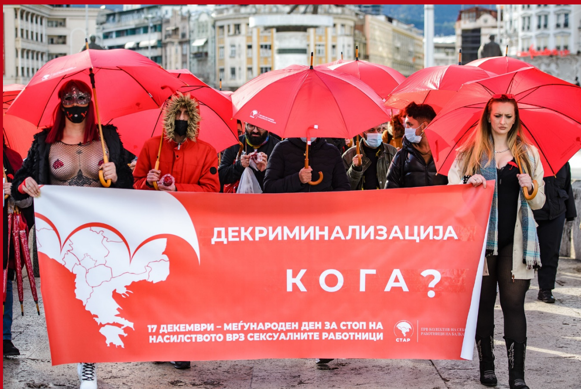
Фотографија: В. Џамбаски, 2021

Обезбедивме висока медиумска поддршка, а за настанот известија 56 национални интернет страници, портали, радија и телевизии.